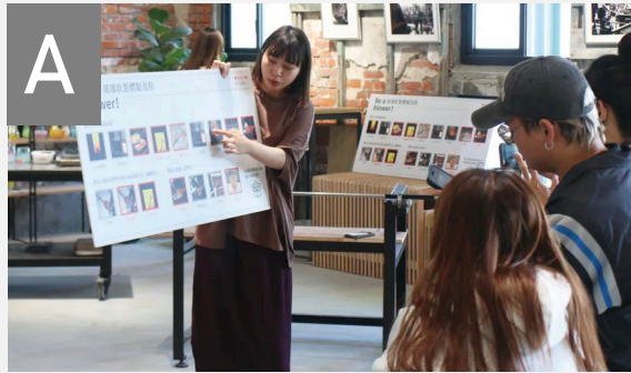
A 工藝導覽 × 展演